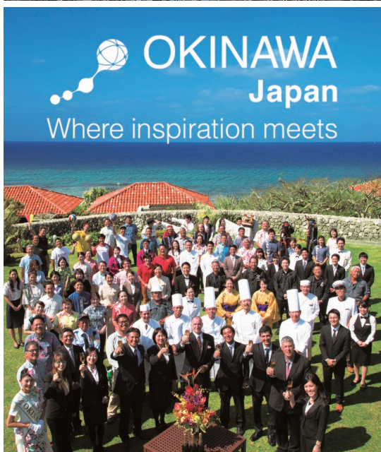
OKINAWA MICE PLAYER'S Lip-Dub ロケ地：万国津梁館